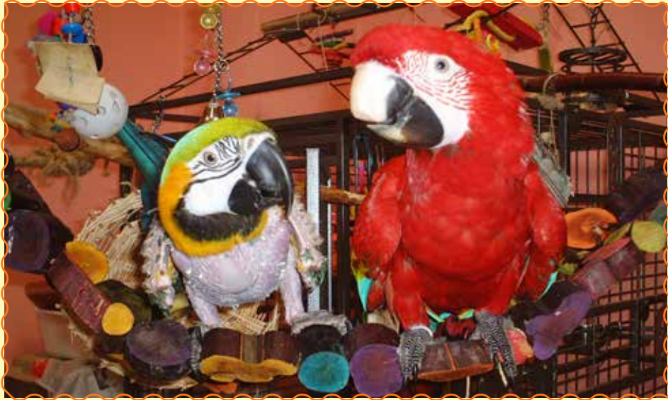
Mithilfe des Clickertrainings kann insbesondere auch die Lebensqualität von behinderten Tieren stark verbessert werden.