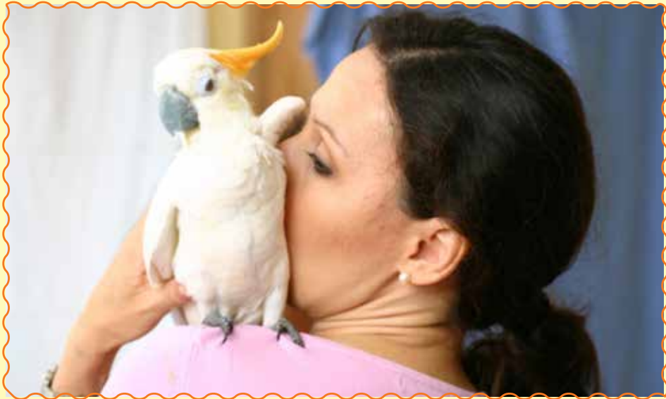
Wie alle Papageien riecht Tina köstlich unter ihrem Flügel.

man in puncto Papageienerziehung bekommt, sind im besten Fall nutzlos, im schlimmsten Fall sind sie völlig kontraproduktiv. Es wird zum Beispiel empfohlen, lauter zu schreien als der Papagei, ihn abzudunkeln, mit der Blumenspritze zu beschießen oder gar auf den Schnabel zu schlagen. Das soll einen Vogel dazu bringen, mir als seinem Halter zu vertrauen? Ich finde diese Methoden respekt- und lieblos dem Tier gegenüber, schlimmstenfalls sogar tierschutzrelevant.