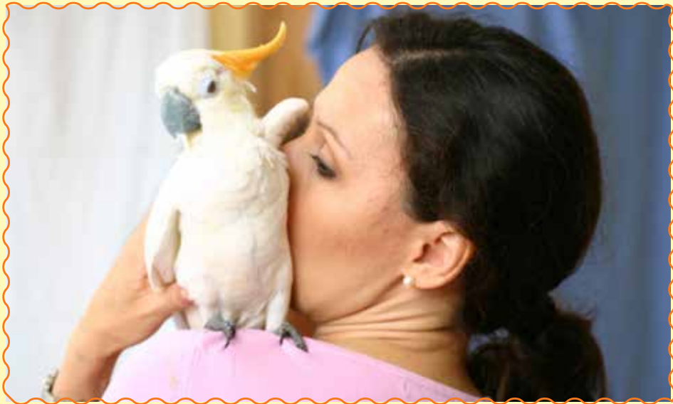
Wie alle Papageien riecht Tina köstlich unter ihrem Flügel.

man in puncto Papageienerziehung bekommt, sind im besten Fall nutzlos, im schlimmsten Fall sind sie völlig kontraproduktiv. Es wird zum Beispiel empfohlen, lauter zu schreien als der Papagei, ihn abzudunkeln, mit der Blumenspritze zu beschießen oder gar auf den Schnabel zu schlagen. Das soll einen Vogel dazu bringen, mir als seinem Halter zu vertrauen? Ich finde diese Methoden respekt- und lieblos dem Tier gegenüber, schlimmstenfalls sogar tierschutzrelevant.