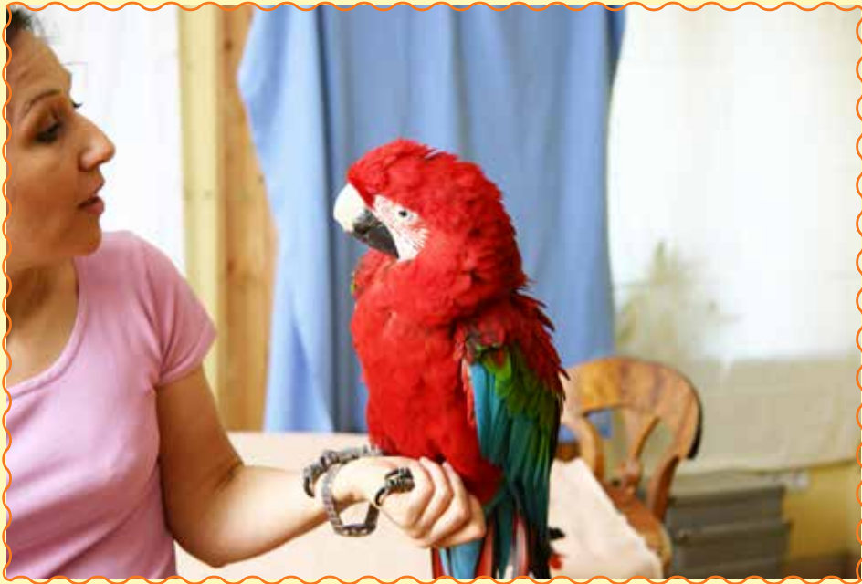
Das Clickertraining hilft Mensch und Tier, besser miteinander zu kommunizieren.

Training aufbaut. Deshalb ist es an der Zeit, mit dieser 8. Auflage eine verbesserte, aktualisierte Version zur Verfügung zu stellen. Ich hoffe, dass diese Auflage ein weiterer wichtiger Beitrag zur Verbesserung und Festigung der Beziehung zwischen Papageien- und Sittichaltern und ihren Tieren wird.