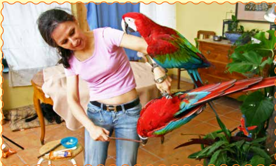
Das Clickertraining macht Lehrer und Schülern gleichermaßen Spaß.