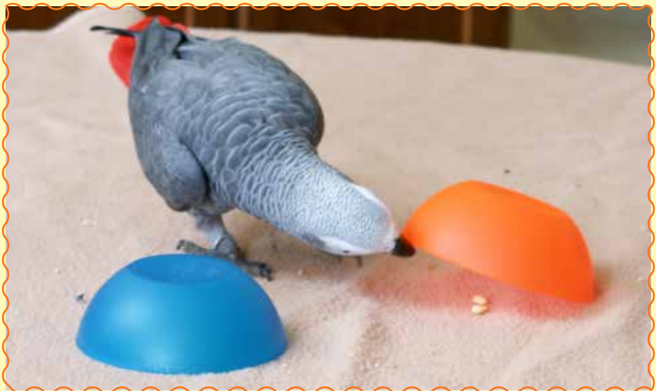
Hector beschäftigt sich mit dem „Hütchen Spiel“ – gelernt durch Clickertraining.

Natürlich konnte ich unsere Trainingserfolge und den Spaß, den wir dabei hatten, nicht für mich behalten. So gab ich im größten deutschen Ziervogelforum immer wieder Tipps an Halter, die Schwierigkeiten mit ihren Tieren hatten, bis der Besitzer des Forums mir ein eigenes Clickerforum einrichtete. Zusammen haben wir mit vielen Vögeln sehr viel erreicht. Ganz oben auf der Trainingswunschliste sind Zähmung, Grunderziehung und Pflegemaßnahmen, aber auch ganz einfach Beschäftigung für diese intelligenten Lebewesen, die sich in der Gefangenschaft langweilen. Weitere wichtige Themen sind das Abgewöhnen von unerwünschten Verhaltensweisen, zum Beispiel Beißen und Schreien, und das