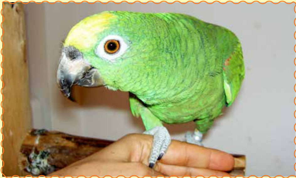
Krank oder gesund? Regelmäßige Untersuchungen durch einen papageienkundigen Tierarzt müssen sein.

Dies ist jedoch für das betroffene Tier ein sicheres Todesurteil. Deshalb verbergen Papageien als Beutetiere ihre Krankheiten und Verletzungen, so lange es ihnen möglich ist. Ist Ihr Papagei erst einmal so krank, dass deutliche Krankheitssymptome erkennbar sind, ist es oft zu spät. Darum ist es empfehlenswert, eine Ankaufsuntersuchung vorzunehmen, um sicherzugehen, dass Sie ein gesundes Tier erworben haben. Dies gibt Ihnen auch eine Vergleichsmöglichkeit im Krankheitsfall. Zusätzlich sollten jährliche generelle Untersuchungen von einem auf Papageienvögel spezialisierten Tierarzt vorgenommen werden. Es ist sehr wichtig, dass Sie mit Ihrem Papagei zu einem wirklich papageienerfahrenen Tierarzt gehen, da gerade bei Papageien, viele Symptome sehr unspezifisch sind, sodass für ein Symptom mehrere Krankheiten in Betracht kommen können. Auch sind die Symptome oft so subtil, dass sie nur mit einiger Übung erkannt werden können. Hinzu kommt, dass einiges an Erfahrung nötig ist, einen unwilligen Papagei zu halten und zu untersuchen.