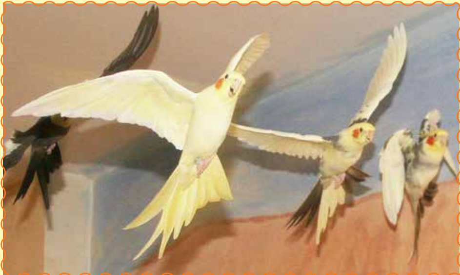
Auch ein ganzer Schwarm artgerecht gehaltener Papageien kann mithilfe des Clickertrainings gezähmt und beschäftigt werden.